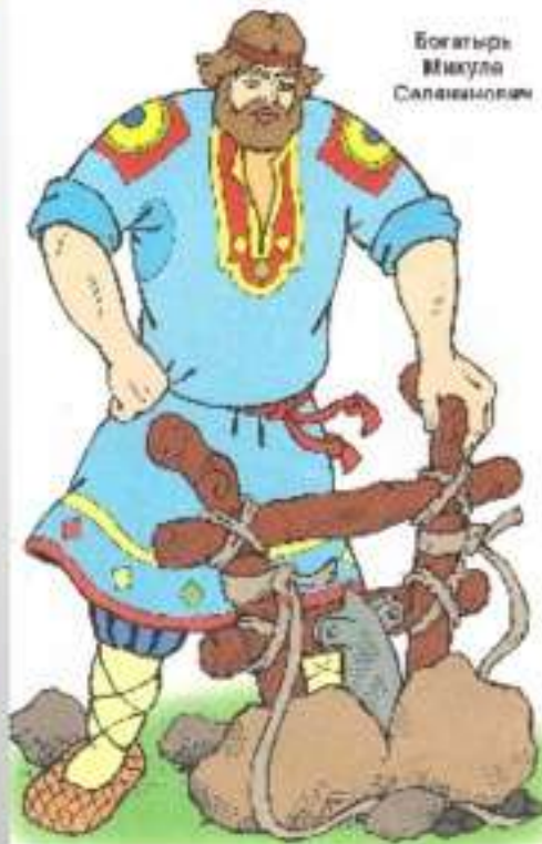
Богатырь Микула Салаватович